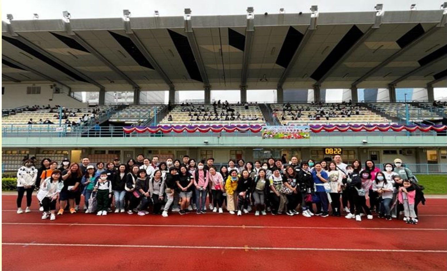
2023年4月4日(星期二)運動會暨親子競技遊戲日家長義工合照