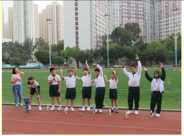
創意十足的各級啦啦隊

感恩不應只在復活節時才進行，應該分分秒秒也常懷感恩的心，為我們已得到並已在身邊的人、事、物致由衷的感恩。誠心祝願合一堂學校每位同學、家長和教職員時刻被主的慈愛圍繞著，常懷主恩的心。