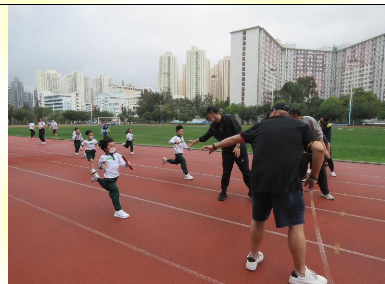
小一/小二級親子接力賽