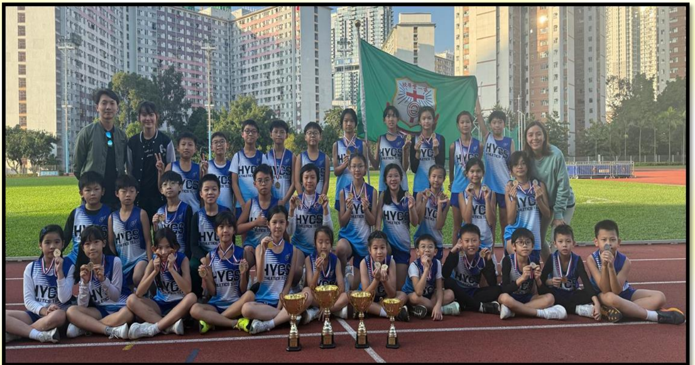
田徑隊於 2024 年 11 月 22 日參加中華基督教會校際小學田徑比賽。榮獲：女甲團體亞軍 / 女乙團體冠軍 / 女丙團體冠軍 / 男丙團體季軍，成績優異。