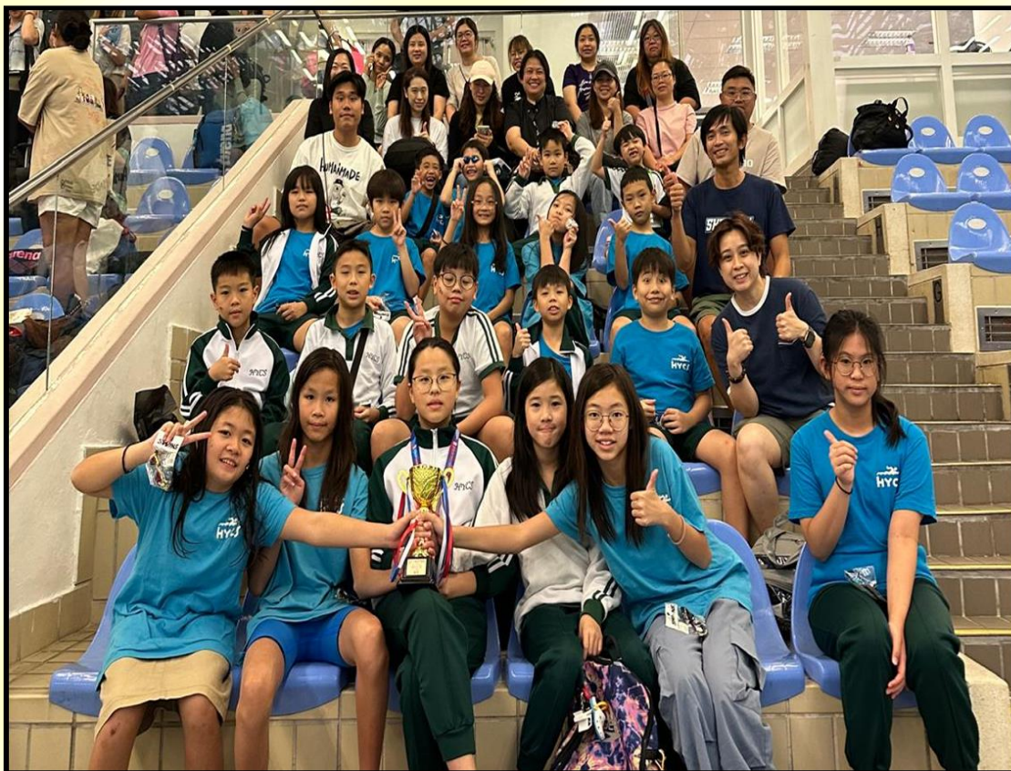
泳隊於 2024 年 10 月 30 日參加中國香港學界體育聯會~九龍南區小學分會校際游泳比賽，榮獲:女甲團體優異獎。

誠然，世間上不存在不勞而穫，想成功便須付出努力，就如螞蟻般有目標及方向地在夏天預備食物，在收割的時候積聚糧食，為嚴冬來臨前早作準備。我們的校隊健兒也像螞蟻般處事殷勤，每年十一月是各類校際比賽開展的日子，因此有不少校隊同學要在繁忙的課堂學習外，尚須接受一連串為應付校際比賽而設的操練。尤幸在老師及教練們悉心的指導下，同學們在不少校際比賽中均全力以赴，表現出色，且與大家分享喜悅：