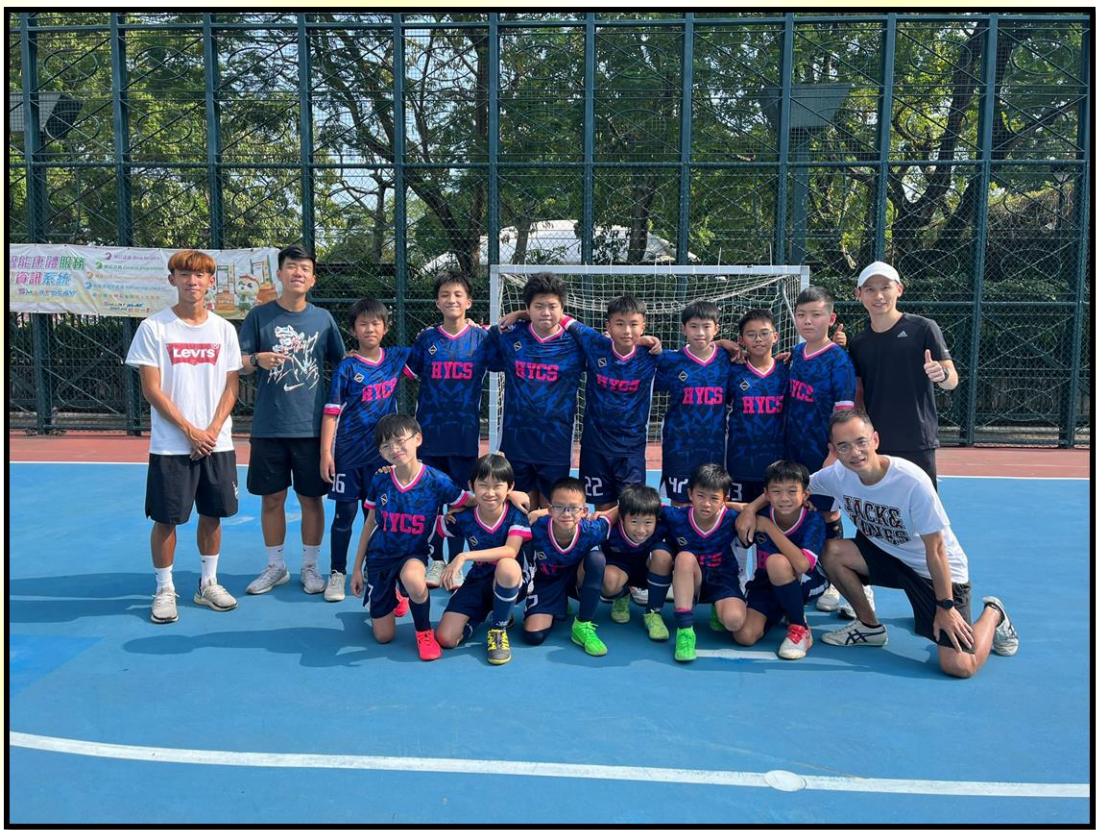
足球隊於 2024 年 11 月 6 日參加中國香港學界體育聯會~九龍南區小學分會校際足球比賽。雖未及晉級，但領隊老師及教練對同學的表現十分讚賞，整體表現比去年進步不少。喜見同學們全力以赴並能享受比賽過程，令我十分欣賞。