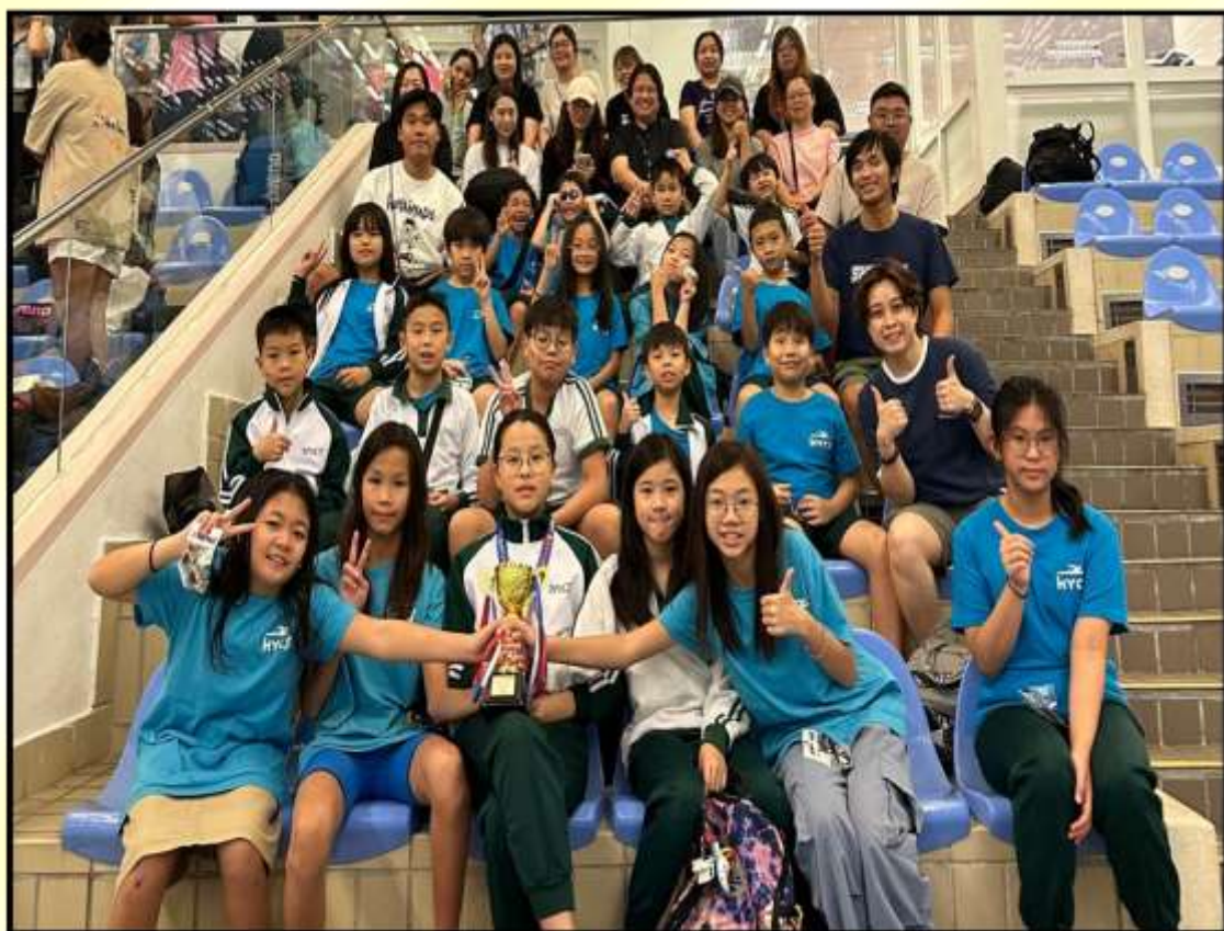
泳隊於 2024 年 10 月 30 日參加中國香港學界體育聯會~九龍南區小學分會校際游泳比賽，榮獲:女甲團體優異獎。

誠然，世間上不存在不勞而穫，想成功便須付出努力，就如螞蟻般有目標及方向地在夏天預備食物，在收割的時候積聚糧食，為嚴冬來臨前早作準備。我們的校隊健兒也像螞蟻般處事殷勤，每年十一月是各類校際比賽開展的日子，因此有不少校隊同學要在繁忙的課堂學習外，尚須接受一連串為應付校際比賽而設的操練。尤幸在老師及教練們悉心的指導下，同學們在不少校際比賽中均全力以赴，表現出色，且與大家分享喜悅：