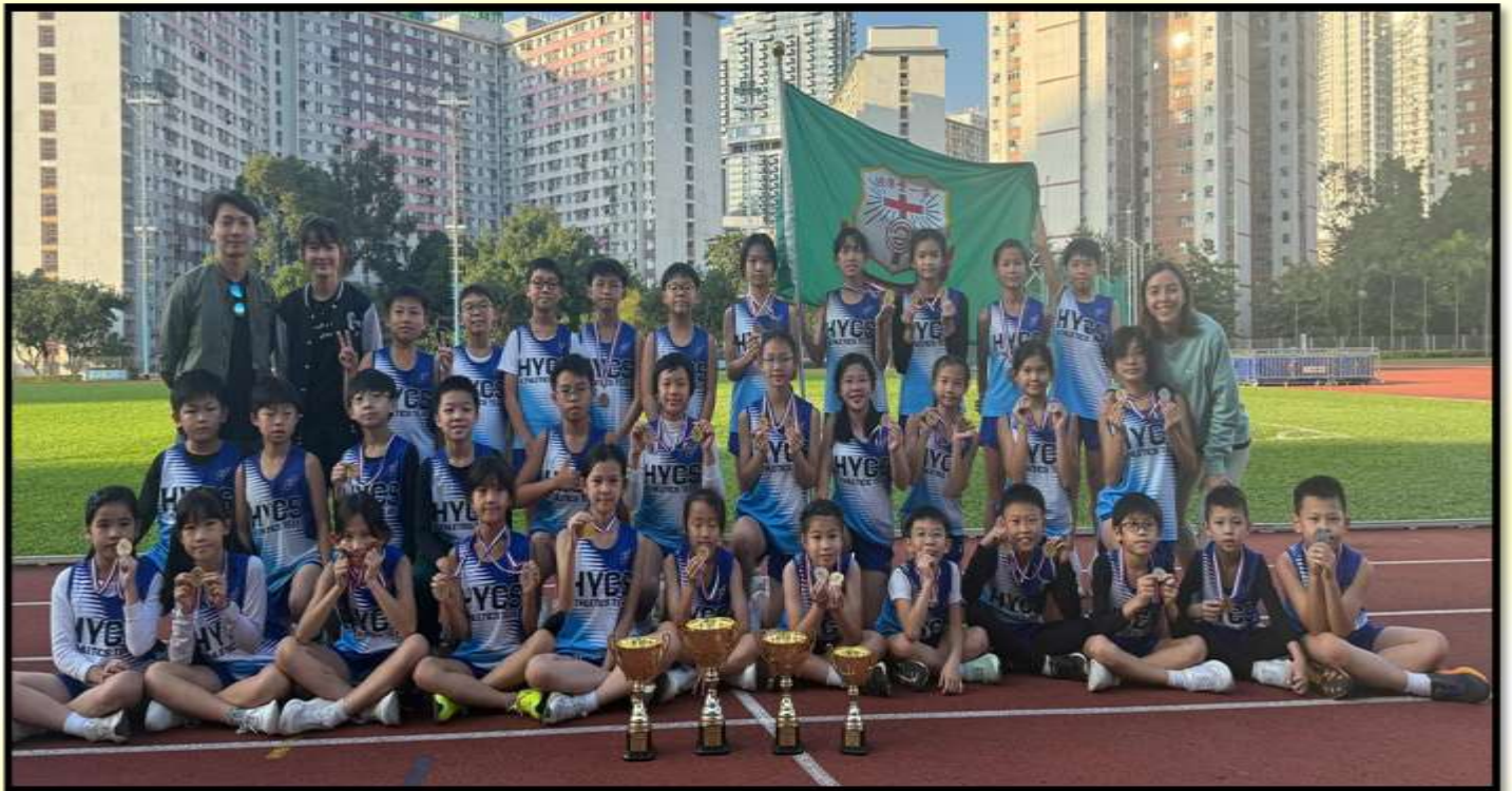
田徑隊於 2024 年 11 月 22 日參加中華基督教會校際小學田徑比賽。榮獲：女甲團體亞軍 / 女乙團體冠軍 / 女丙團體冠軍 / 男丙團體季軍，成績優異。