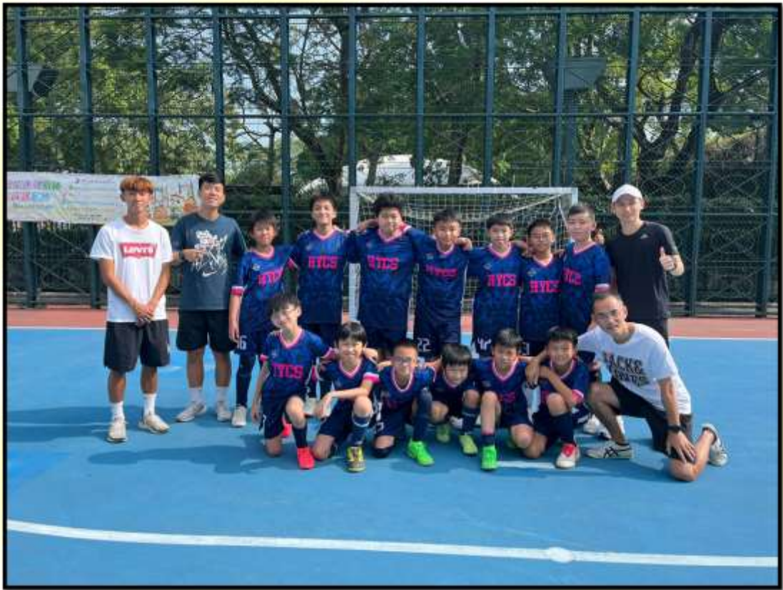
足球隊於 2024 年 11 月 6 日參加中國香港學界體育聯會~九龍南區小學分會校際足球比賽。雖未及晉級，但領隊老師及教練對同學的表現十分讚賞，整體表現比去年進步不少。喜見同學們全力以赴並能享受比賽過程，令我十分欣賞。