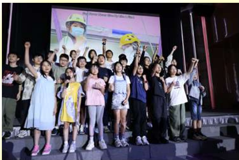
常存感恩的 6B 同學表演及與嘉賓、家長及老師合照。