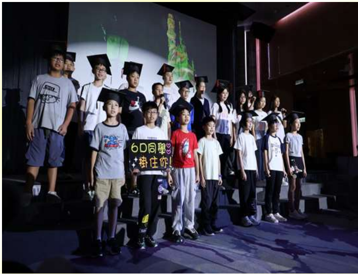
善解人意的 6D 同學表演及與嘉賓、家長及老師合照。