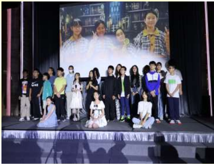
尊師重道的 6A 同學表演及與嘉賓、家長及老師合照。

在這六年間，我相信每位小六同學都經歷過歡笑，也有過挑戰。每一節課堂、每一次活動、每一個瞬間，都會在同學們心中留下深刻的印記。看到同學們在謝師宴上感謝各位老師的辛勤付出，我想各位老師也全收到了(包括暖心的花茶)。誠然，老師們的教導不僅能讓同學獲得知識，更教導了同學們如何面對生活的挑戰。這些年來，老師們的辛勤付出以及家長們的全力支持，都是各位同學成長路上的堅實後盾。謝師宴不僅是對老師們的感謝，更是對每位畢業生努力的肯定。