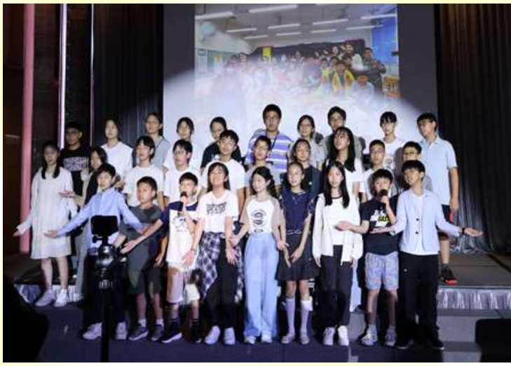
積極靈動的 6C 同學表演及與嘉賓、家長及老師合照。