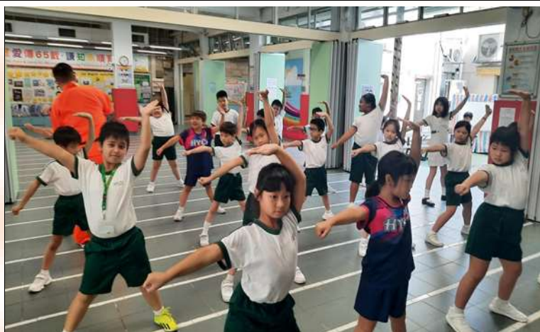
小三級：少林基本拳