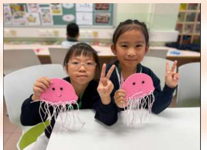
小二級：海洋守護隊