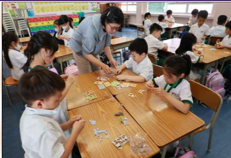
小二級：方舟動物園