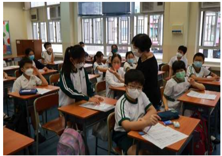
小六級：合一好聲音 (校監到校教同學唱歌技巧)