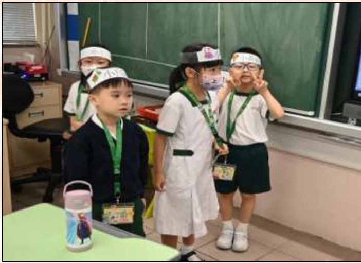
小一級：普通話小演員