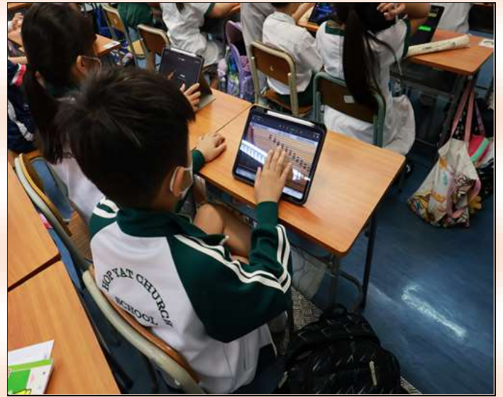
小四級：牧童笛 x GARAGE BAND