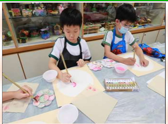
小四級：中華藝術齊欣賞