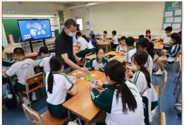
P.6 : A Board Game Adventure