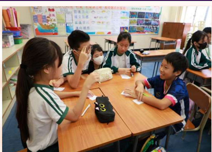
P.2 : CARD BATTLE