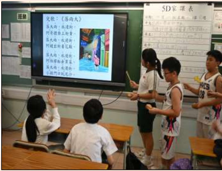
小五級：查篤撐粵劇工作坊_數白欖真好玩